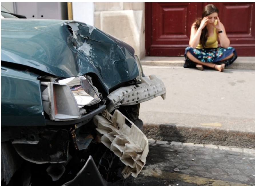
Sinds slachtoffers van ‘doorrijden na een aanrijding’ digitaal aangifte kunnen doen, is het aantal aangiften met vijfhonderd procent gestegen

Volgens Den Uyl hebben de partners in de publiek-private strijd tegen voertuigcriminaliteit in toenemende mate last van zogenoemde Moe-landers, oftewel Midden- en Oost-Europeanen. “Heel grote stromen auto’s, maar ook apparatuur verdwijnen richting Midden- en Oost-Europa. Wij willen met name de georganiseerdheid ervan tegengaan. Dat past ook helemaal in ons beleid dat wij steeds meer kijken naar internationale bendes. Mobiel banditisme noemen we dat, het zijn een soort rondreizende bendes die ons land doortrekken en zich ook met auto’s bemoeien. PPS is daarbij heel belangrijk en werkt echt. Wij zoeken steeds vaker de grenzen op. Sinds kort werken we met de Wet Politiegegevens en wellicht moeten we eens met het Verbond om de tafel, zodat we, naast de convenanten die er al zijn, nader kunnen kijken naar het belang van nieuwe convenanten. In de praktijk kan inmiddels veel meer. En, eerlijk is eerlijk, als het de opsporing bevordert, zijn wij niet zo snel tegen.” ■