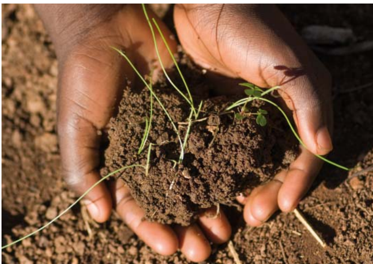
Voedselschaarste treft vooral Afrika

Uit de Political Risk Map zelf blijkt dat de wereld dit jaar opnieuw onveiliger is geworden. Politieke en financiële stabiliteit als gevolg van de wereldwijde economische crisis kenmerken het internationale handelsklimaat. Het risicoprofiel ligt voor achttien landen hoger dan in 2009. Jemen, Soedan en Venezuela zijn zelfs gestegen naar de risicocategorie 'zeer hoog'. Daartegenover staat dat negen landen een lager risicoprofiel kregen. Nederland heeft, net als alle andere West-Europese landen, de gradatie 'laag risico'. ■